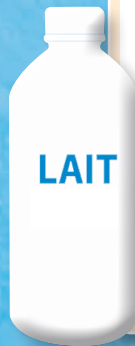
Graphique 5a : consommation moyenne de lait liquide en 2008 (en kg par an et par personne)