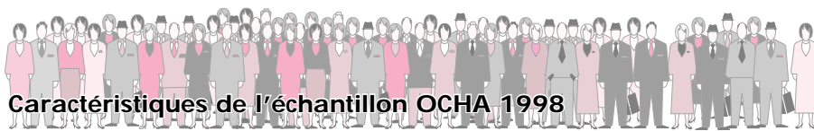
Caractéristiques de l'échantillon OCHA 1998